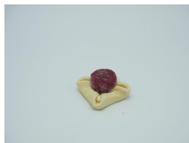
Slika 1: Ne pečen proizvod