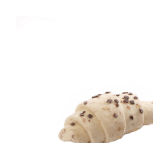
Imagen 1: Producto sin hornear