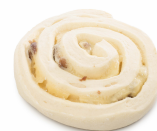
Slika 1: Ne pečen proizvod

Fotografije su samo indikativne, moguće je malo odstupanje od stvarnosti.