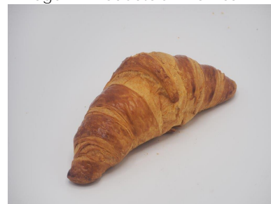
Imagen 2: Producto horneado