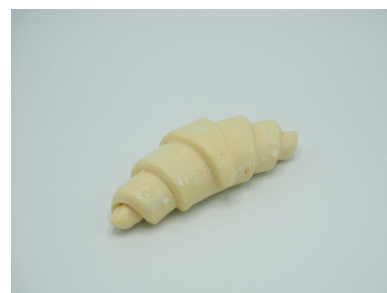
Imagen 1: Producto sin hornear

Las fotos son solo indicativas, es posible una ligera desviación de la realidad.